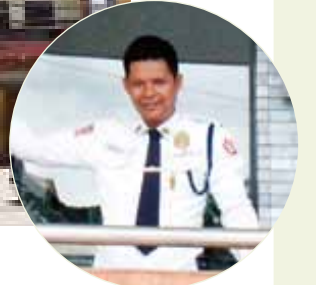
ガードマンさんも笑顔でお出迎え